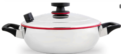
Royal Prestige® Paella Pan