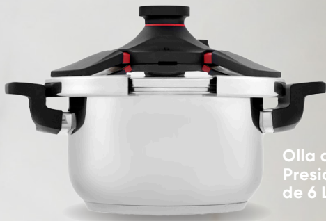
Olla de Presión de 6 L