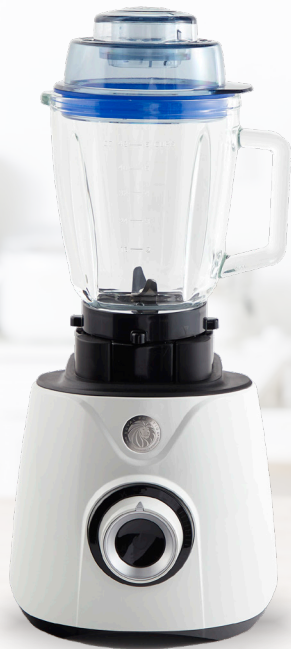
Royal Prestige® Power Blender Max