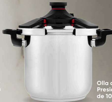
Olla de Presión de 10 L