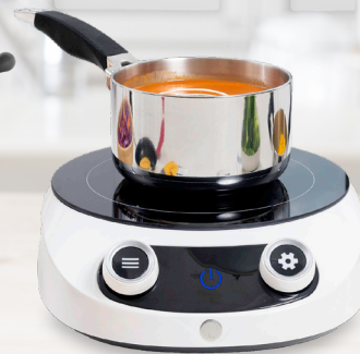
Royal Prestige® Precision Cook