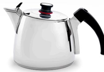
Royal Prestige® ExperTea