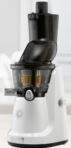
Royal Prestige® Juicer