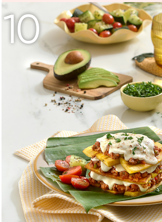
Medallones de res en salsa de mostaza