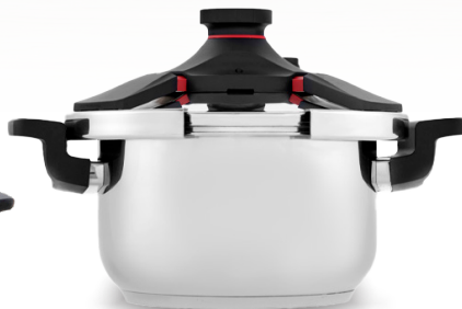
Royal Prestige® Pressure Cooker