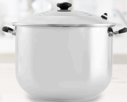
Royal Prestige® Stock Pot