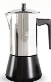
Royal Prestige® Espresso