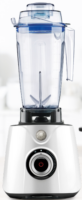
Royal Prestige® Power Blender