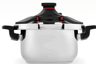
Royal Prestige® Pressure Cooker