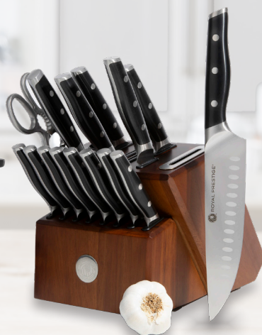
Royal Prestige® All-In-One Knife block