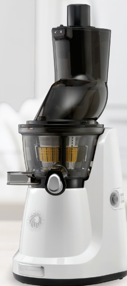
Royal Prestige® Juicer