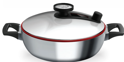
Royal Prestige® INNOVE™ Paella Pan