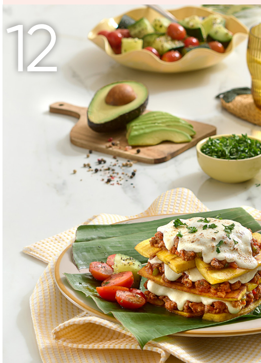
Lasaña de plátano