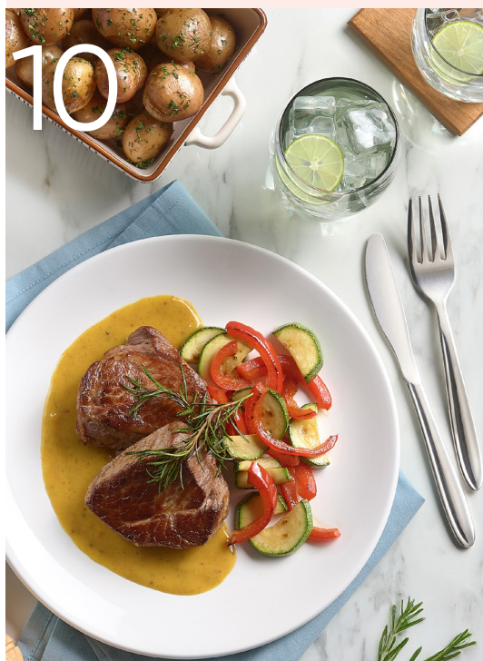
Medallones de res en salsa de mostaza

Sabores que inspiran, recetas creadas para encuentros especiales y bienestar que se disfruta en familia.