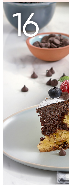
Pastel de chocolate y chocolate