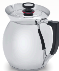
Royal Prestige® Chocolatera