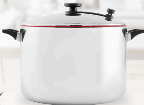
Royal Prestige® Stock Pot