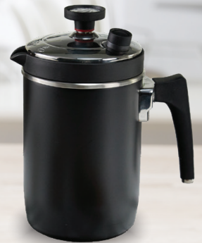
Royal Prestige® Barista