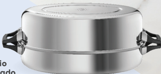
Utensilio destacado Royal Prestige® Pavera de Royal Prestige®