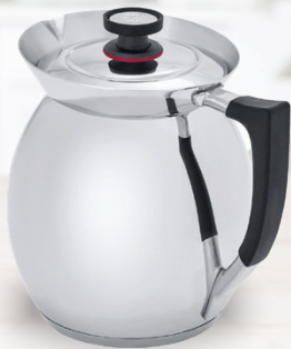
Royal Prestige® Chocolatera