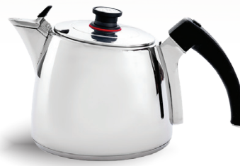
Royal Prestige® ExperTea