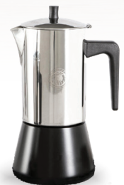
Royal Prestige® Espresso