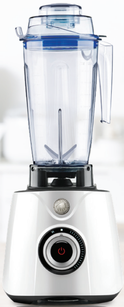
Royal Prestige® Power Blender