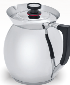
Royal Prestige® Chocolatera