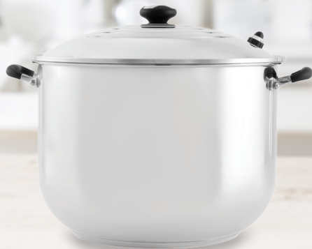
Royal Prestige® Stock Pot