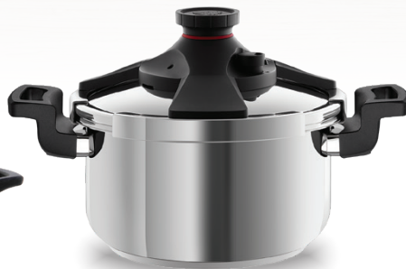
Royal Prestige® Pressure Cooker