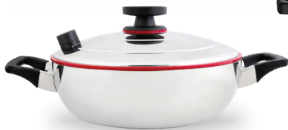
Royal Prestige® Paella Pan