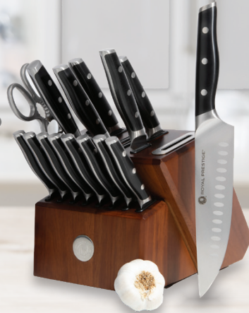
Royal Prestige® All-in-One Knife Block