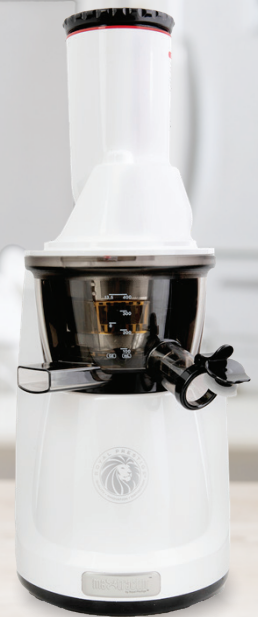
Royal Prestige® maxTractor