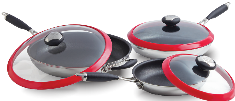
Royal Prestige® Deluxe Easy Release Skillet Set